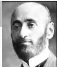
Օադունով գողթանցիներ, գոկեր...