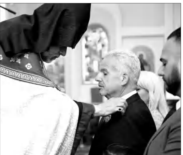
սու Կոնդակով շնորհակալ ենք Ձեզ Առաքելական մեր Սուրբ Եկեղեցու ԱՄՆ Արեւմտեան Շնորհալիի դասակ շնորհակալ:

Ազգային եւ եկեղեցական Ձեր արդարութեան ծառայութեան բարձր գնահատականով, սիրով ընդառաջ թեմական առաջնորդի խնդրանքով, Հայրապետական այ-