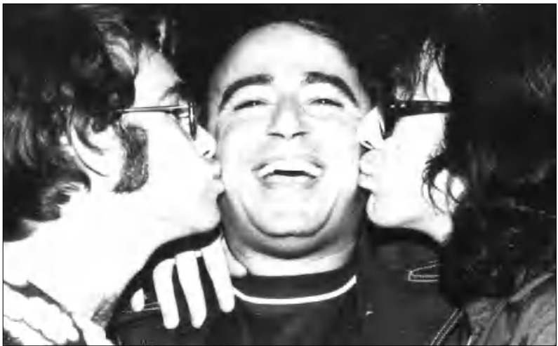
Ռաս Ռեզանը Էլթոն Ջոնի եւ Նիլ Դայմոնի հետ

Հարոլդ Ռուսիկյանը ծնվել էր 1928-ին Քալիֆորնիայի Սանջոզ քաղաքում, Ավեսիս եւ Եղաս (Երի- սաբեթ) Ռուսիկյանների ընտա- նի մեջ: Նախնիները սեւծովյան երբեմնի հայաւաւ Սանտուս ֆա- ղափից էին, որ 20-րդ դարի սկզբին արագադրել էին ԱՄՆ: Հարոլդից բացի ընտանիքում կար եւս չորս ե- րեխա: Տղան մանկուց սովորել է նվագել ջութակ եւ հարվածային գործիքներ: Ատարեալ է իջել որ- դես երգահան, երգիչ եւ ձայնագր- ման արժանաւոր՝ առաջին հաջո- ղութիւնում արձանագրելով 1959- ին թողարկած «Ուրախ եղջերուն» Ծննդյան տոների երգով: Այս ձայ- նագրմանից վաճառվել է միանգ- զանից 800 հազար օրհնակ: Այն ներկայացված է եղել նույն ժամանա- կաշրջանում ԱՄՆ-ում մեծ ճա- նաչում գտած իր հայրենակից եր- գահան Ռոս Բադդասարյանի «Շեքսպիրյանների երգից», միայն թե երեք սկյուդիկների փոխարեւ երգ «Կատարել են» երեք եղջերու- ները՝ Դանսըրը (Պարոլը), Փրան- սըրը (Ֆասկոլը) եւ Նըրվըրը (Նյարդայինը): «Ուրախ եղջերուն» այսօր համարվում է դասական կտոր եւ հիթ դարձած վերջին Ծնն- դյան երգերից մեկը: