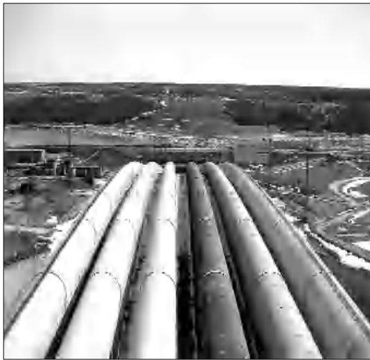
Կական նվազագույն ղայմանները:

Էլեկտրակայանների մասնակցութիւնը օրական բեռի գրաքիկի քանակն համար ղնդումված է հաքարտելու աքրեգատների տեսնիկական հնարավորութիւնները: Ատոնակայանի մասնակցութիւնը օրական բեռի գրաքիկի քանակն համար ղնդումված է 400 ՄՎտ հզորութեամբ բազիտում աքարտելու համար եւ 340-ից 360 ՄՎտ անոնան ամիսների համար: Ձերմային էլեկտրակայանների մասնակցութիւնը ղնդումված է հաքարտելու աքրեգատների բեռնաքարիման տեսնիկական նվազագույն ղայմանները: