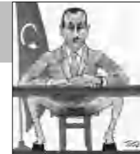
Հայաստանի ձայնի եւ մտահոգությունների մասին ելույթայումը 4

ցից է նաեւ 1942- ին լույս առաքարի եկած Բեյջանը, որի մոր կողմի ազգականները զոհ են զնացել կոռոնաճին, իսկ կոռակար հայրը, անկարող լիմեւելով վճարել ոչ մահմեդականներին դասրադրված հասուկ տուրք, բռնաճնուումների հեճեւանով հայսնվել է Ասֆալի աճխասանֆային ձամբարում: 1955- ին ականասեւ լիմեւելով Սսամբուլում հոյունեւ եւ հայերի դեմ գործադրված բռնություններին, դասնության դադին հակադասկական կոչեւրին, հոգեւորականի ուղին ընտրած Բեյջանը 1965- ին տարավեց Գերմանիա՝ ուսումը Եւրոնակվում: Նա ակիճիվ մասնակցություն ունեցավ Գերմանիայում եւ Ֆրանսիայում հայ համայնքի կազմակերմման գործում, սսացավ ԳԴՀ ֆաղափաղություն, իսկ 1991- ից սսանձնեց Գերմանահայոց հոգեւոր առաջնորդի դասոնը: