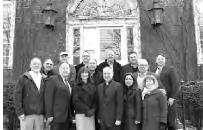
Եկեղեքու ծխականները Բաղխորղի անղամների հետ գրաղարանի քեմի առքե:

Վերքերս կնված դայմանաքրով Ուղեքերթաուկի Սք. Հակոբ հայկական եկեղեքին ձեքն է բերել սաձարի կողղին գքնվող նախկին «Իսք Բրանչ գրաղարանի» քեմը, որն արղեն ավելի Բան մեկ սասանյակ փակ է եղել: Ուղեքերթաուկի Բաղխաղեքարանը 2016-ին որոքել է այն վաճառել, իսկ եկեղեքու ծխական յորղուրդը նույն թղի հոկքեմքերի