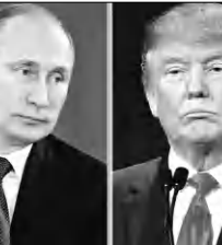
ԱՄՆ-ԲԳ. դեռ չեն գիտակցում, բայց պատերազմն արդեն... 12