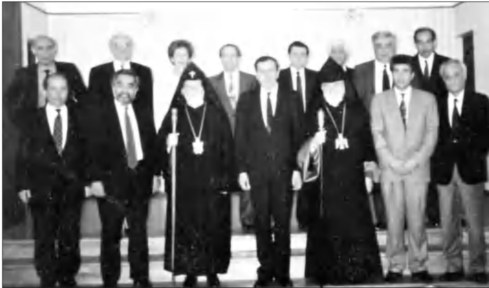
1992-ին ստեղծուած «Հայաստան» համահայկական հիմնադրամի հիմնադիր կնհահարեւոյ մասնական միակ խմբանկարը Սեզի ծանօթ դէմքերէն առաջին Երեւանի մէջ կ'երեւին՝ ձախէն աջ՝ Բարսէն Արարեան, Հայր Յովնանեան, Երջանկայիցեան Ամենայն Հայոց կաթողիկոս Վազգէն Ա., ՀՀ նախագահ Լեւոն Տր-Պետրոսեան, Անթիլիասի երջանկայիցեան կաթողիկոս Գարեգին Բ., Գագիկ Յարութեան, Երկրորդ Երբի վրայ՝ Հրանդ Սաթեմեան, Արաւիք Կեդրեան, Լուիզ Սիմոն-Սանուկեան եւ ուրիշներ

Տեղին է յիշել այստեղ, որ այլ գաղափարներն անկախաբար, մեզմ որդէն ՌԱԿ Կեդրոնական վարչութիւն, հիմնադրամի այդ ծրագրին մասին կանոնադրելու յարմար ներառաբար ներկայացուցած էին նախագահ Տր-Պետրոսեանին այդ սարիներուն իրեն դրկուած մեր յաջորդական Memorandum-ներուն մէջ, որոնցմէ մէկուն փնտրուողը կատարեցին անձամբ իրեն հետ, իր սան մէջ,