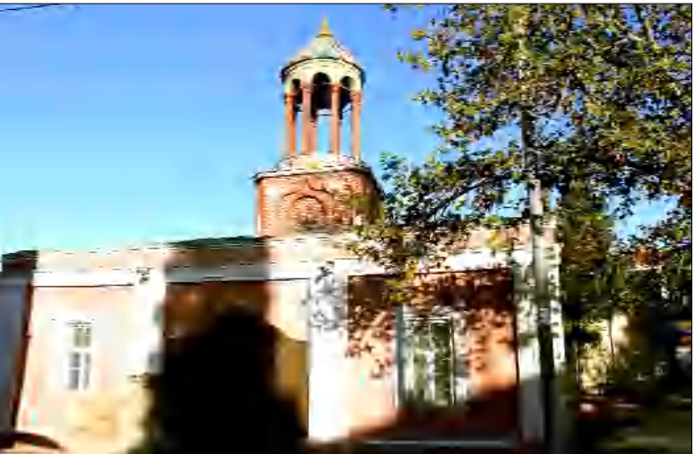
Քանաքոպոլիսի Սուրբ Հովհաննես Սկրիչի եկեղեցին: Երեւանյան 1988 թվականի հանրահավաքներից մեկի ժամանակ դասնեցին, թե ինչպես հայրենի հավաքից ու մշակութային որոշ չափով հեռացած Քանաքոպոլիսից մի սկիզբ մասսադարվել էր եկեղեցում եւ այնտեղ նորածին մի տղայի մկրտեցին Անդրանիկ անունով...