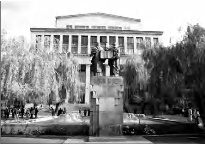
Պատկերը ցուցաբերում է Երևանի համալսարանի շենքը: