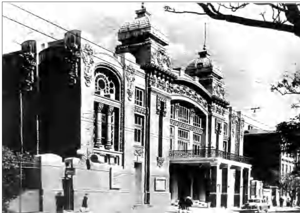
Մայիսյան եղբայրների օդերային բասրոնը Բախարում, 1911 թ.:

դարբերաբար մասնակցել են աղբեջանական ներկայացումներին: