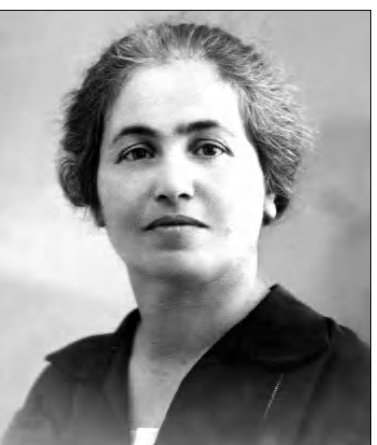
Լավ կարգում: Երբ ֆույրս աստի-րանսուրան ավարտեց, իսկ ես՝ համալսարանը, եւ արդեն ի վիճակի էիմք թեթեացնել նրա հոգը, ավաղ, նա կյանքից հեռացավ: Ասես ամեն ինչ ձեռք - չափել էր այնպես, որ կարողանար միայն մեզ ոտքի կանգնեցնել: Ես ու ֆույրս մեր որդիական դարսքը մի փոքր անգամ չկարողացանք վերադարձնել: Վերջը՝ հաջորդիվ

թյուններով լեցուն սարհներին: Չարմանում են, թե մորս փորում ուներ ուրբան փորձությունների դիմացան: Երբեմն նա ինձ դասեր էր տալիս, անվարժ ուղորդի տեղով, որը, չիմանալով, թե ծովը խորն է, մեկնում է ավիների մեջ ու լողում: Չի խորհրդակցում, որովհետեւ չի դասերազմում խորությունն ու իրեն ստառնացող վստազը: Բայց իրականում մի՞թե այդպես էր, մի՞թե նա չէր զգում ծովի խորությունը: Պարզապես բնությունը նրան օժտել էր հոգեկան մեծ ուժով ու դաստիարակությամբ: Վիճակն ու դասությունը սանում էր գուստ, նրա Երբեմնից սրտունց, դժգոհություն չէր լսվում: Միջոց մեր ընտանիքի վիճակը համեմատում էր նրիցների հետ եւ հավասացնում, որ մերն ավելի լավ է: Ուրիշ վիճակ մեծացնում էր, մերը փոքրացնում եւ կարողանում էր ինձ ու ֆրոնս համոզել, որ մենք երջանիկ ենք, բայցից դժգոհելու դաստառ չունենք: Իսկ վաղը, երբ համալսարանն ավարտեմք, ցած