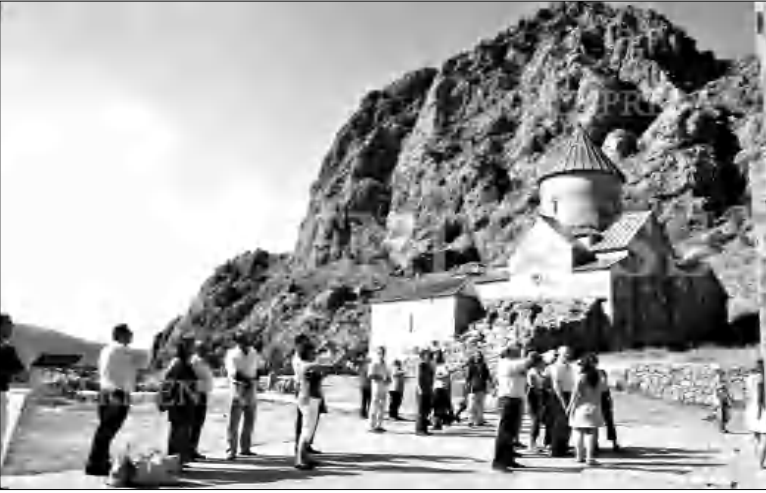
Կու Ակասառում ղեկավարվող զբոսաբեկիկների խումբը:

Փետրվարի 23-ին, երբ ուժի մեջ մտավ Ռուսաստանի Դաշնության փոփոխված Դաշնության ֆալգի համարներին անձնագրերով Հայաստան այցելելու որոշումը, Երևանի կենտրոնում գրեթե ամեն ֆայլի հանդիպում էին ռուսասանցի զբոսաբեկիկների խմբեր: Դա հիշեցնում էր իրանցի զբոսաբեկիկների զանգվածային հոսքը Հայաստան, որ սեղի է ունենում մասնավոր վերջին, բայց ռուսասանցիների դեմքում այն ավելի փոքրաթիվ էր: