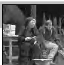
Արծալաբույնի պրեմիերան մայր թատրոնի բեմում էջ Ա,Բ