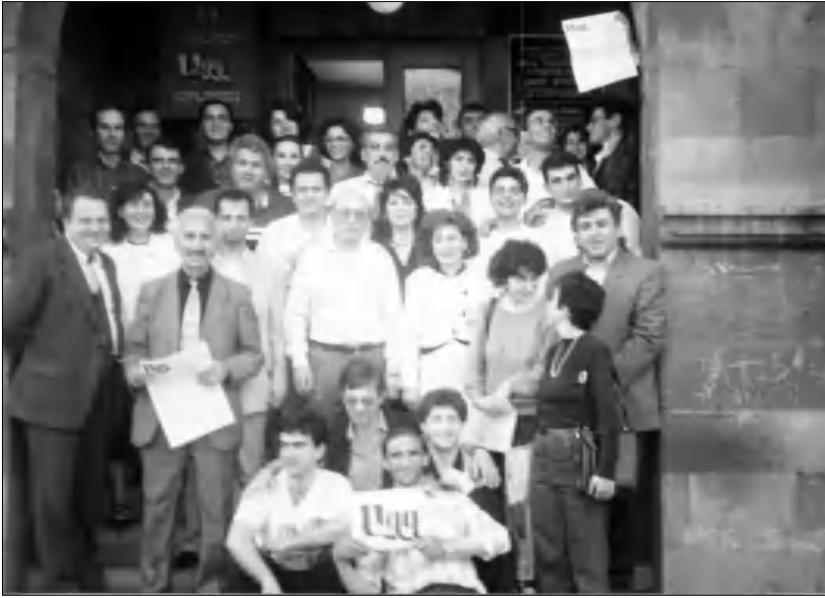
1996թ.: «Ազգ»-ը փակելու ՀՀ արդարաղաշտության նախարարության որոշման դեմ դասարանի վճիղ հետ աշխատակիցները տնում են իրենց հաղթանակը: