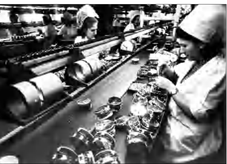
Երեւանի ժամացույցի գործարանում

Բացի դրսևանութեան վարժուելու փորձէն՝ խորհր-