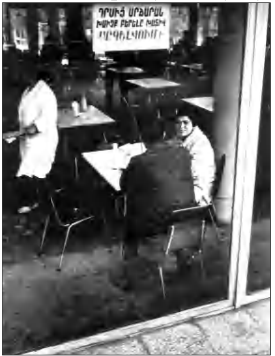
Ալկոհոլիզմը կենցաղի մաս

Թէ որքան անկախ էր խորհրդային Չայասանը՝ չափանիշ մը չէ անոր լաւ կամ վատ ըլլալու իրականութեան: Որքան ալ ուզենք ազատ անկախ դառնալ մեր վեց դարու դրսևանագրկ կեցոյթիւնը մեր մէջ թուլացուցած էր ինքնակառավարման փորձն ու հետաքրքրութիւնը: Անոր փաստերէն մէկն ալ այն է, որ մենք չկարողացանք յաջող Առաջին Չայասանութիւնը, նախ մեր ներքին անմիաբանութեան դասառաճով ու նաեւ՝ արտաքին փաղաքական իրարաճութեանց հետեանքով: Այսօր, այնքան ռոմանթիկ դասկերացում մը ստեղծած ենք Առաջին Չայասանութեան մասին, որ մոռացութեան կու տանք անոր երկրորդ տարուան անագրսութիւնները, կամայականութիւնները, կառավարման սիրողական մակարդակը եւ կարճ ժրջան մը ետք՝