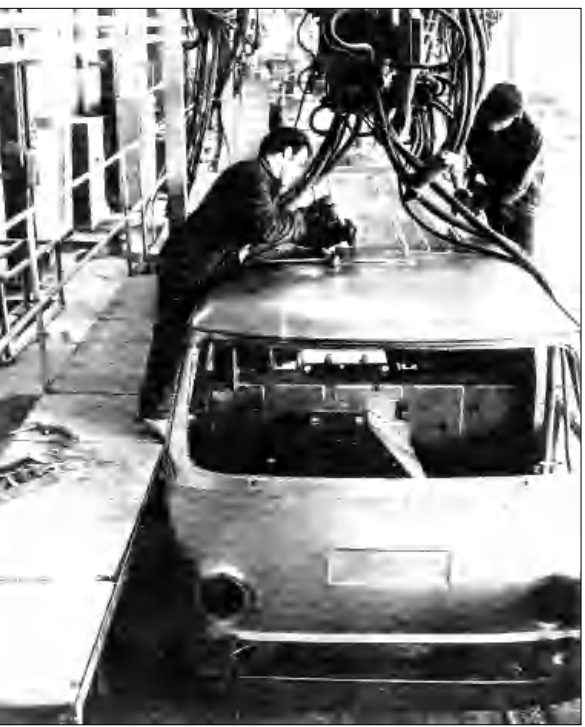
«Երազ» ավտոմեքանական գործարանում

Մեր երեք հանրապետութիւններէն ամենէն երկարակեացը խորհրդային Չայասանն էր, որ իր գոյութեան 70 տարիներուն ընթացքին խորաքա ձեակերթեց մեր մշակոյթը, մեր գիտական միտքը եւ մեր ինքնավարութեան վարժութիւնը: