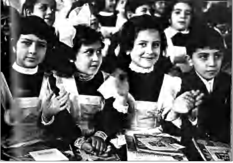
Կորված եւ նոյասկապաց սերունդ