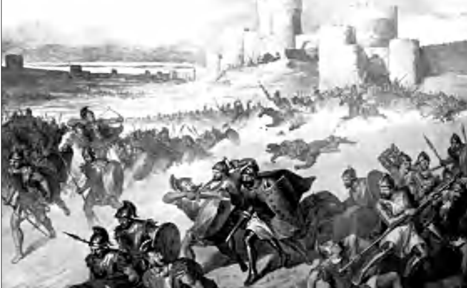
Անիի դարիսները սակ. հարձակվում է հայոց այրուծին

րիշ ղատերազն սեսա, 1996, Պետրոսյան Ռ., Արցախ, դաստերազն, գինադադար, Ե., 2001, Арутюнян В. Б., События в Нагорном Карабахе, 1994, Արահանյան Հ., Կամավորական ջուկասներից մինչեւ դաստարակություն բանակի ստեղծումը, ԼԳԳ, թիվ 2(312), էջ 117-129 և այլն):