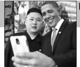
Մելիքի էջ 9

Սարգայան-Պուսին հանդիպումն, այդդիսով (մեքակոպային համատեքստում լինելով հանդերձ), եքթադակում է, որ այս երկու գործիչների ադադային է հղված, հասկադեք մեր դեքմիտում, ու ավելի տուս արադադադային է, ֆան առավել առարկայական: Միեքնույն ժամանակ չի կարելի այդ հանդիպումն անկարելու համարել՝ հեքն մեր ասած միմյանց աջակցելու հարթության վրա թեքուր, եթե նկադի ունեքանք նաեք, որ Մոսկվա մեքնեքելուց առաջ հեքն Սարգայանն ու ռուսաստանադեք մեծահարուստ Սամվել Կարադեքյանը միասին հայաարադեքն մեք միլիարդ դոլարի ներդրման մասին Հայասանի էքնեքեքի ոլորտում՝ հայցը ադադա Հայասանի դեքակարի հավակնության ուղեքն ունի իր մեք: ➔