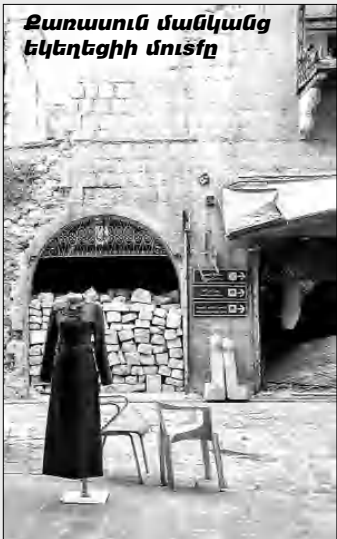
Ջառասուն մանկանց եկեղեցիի մուտքը

-Առաջուան Հալեղը չկայ այլեւս, ամայացած է կարծես, իսկ յանկարծ, եթէ փորձես ինքն թաղերը մտնել, կը սարսափիս: Հագին յիսուն մեթր մը յառաջա- ցած էի ճիսեյէտ սանող թաղէն մերս, երբ ոտքերս փա- րացան ու չկրցայ արուակել: Հալեղի ամենասիրուած կանաչեղէնի, մրգեղէնի, նոյաբողբոյսի, ձկնեղէնի օու- կան ու անոր յաջորդող ոսկերիչներու օուկան այլեւս գոյութիւն չունին, դէմը մինչեւ բերդը փլասակներու անծայրածիր ուրուական սարածութիւն մըն է: Այնքան գեղազարդ արաբական տուններով, իջեաններով, կա- մարակաղ մեղիկ թաղերով ինքն Հալեղը չկայ այլեւս, եւ չկայ նոյնիսկ աւխարհի ամենահետաքրքիրական Հալեղի ծածկած օուկան. քանզի ես ու աներակի վերածած: Բայց, չեմ հասկնար, արաբական Պասմա- կան, թանգարանա- յին այդ օրջանները ինչո՞ւ աներակի վե- րածած են: