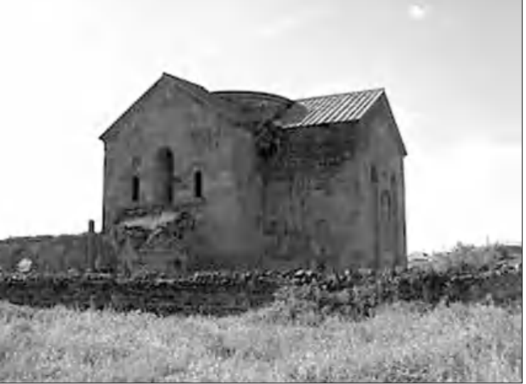
Սուրբ Գամբարձան եկեղեցին

բար էին դասկարգել և ցանկանում էին այն տեղադրել իրենց եկեղեցու բակում: