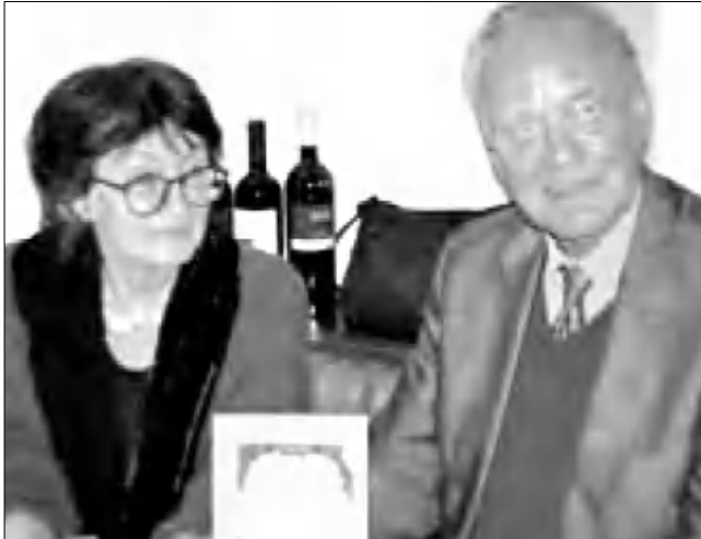
Վուլֆգանգ Գուստը տկոնց հետ

Հայ-գերմանական ընկերությունը (Deutsch-Armenische-Gesellschaft, DAG) հաճույքով հայտարարել է, որ «դասավոր անդամի» կոչում է արժանացրել Հայոց ցեղասպանության ճանաչման եւ ուսումնասիրության գործում նեանակալի ավանդ ներդրած Վուլֆգանգ Գուստին, տեղեկացնում է Բեռլինից Սուրիել Սիրաֆ-Վալսթայնը: Այդ առթիվ հրադարակված հայտարարության մեջ դիկս. Բաֆֆի Քանսյանը նեել է, որ մեծ դասիվ է նրա նման մի անձնավորությանն ունենալ ընկերության դասավոր անդամների արբերում: «Նրա մեծագույն ավանդն այն է, որ գերմանական արտադրանախարարության արիվներից դուրս է բերել բազմաթիվ փաստաթղթեր Հայոց ցեղասպանության վերաբերյալ, ուսումնասիրել, խմբագրել եւ մեկնաբանել նախան դրանց հասանելի դարձնելը համացանցում: Նրա եւ կնոջը՝ Սիզիլիի ստեղծած կայքը