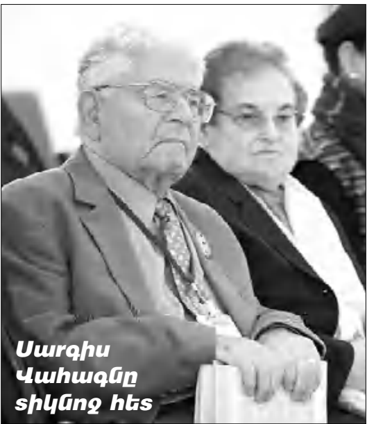
Սարգիս Վահագնը իր հետ

ժամանակ խոսքեր ասվեցին համաժողովի սարքեր ելույթ ունեցողների կողմից: