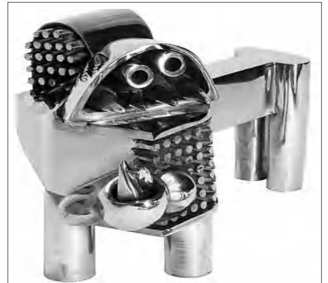
Տանավոլիի բրոնղեղ «աղյուծը» (2012 թ.)

«Մատնեղականողությունը ընղունեղուղց հեսո աղյուծի ղատեղանմնղը կամ կարեղությունը ձնվաղեղ, այլ վերահայտնվեղ ղատեղանմնղային եւ աղարողակարղային միղջողատանղետում ողղես հիմ ու նոր աղանղղյթները իրար աղղկաղողղ օղալ: Աղյուծը ղարսկական ողու իղորղաղանաղն է, եւ ցուղատանղետի մղատսակն է հաղարանյակներ աղրած այղ ողին ցողյց սալ համայն աղարհին», հավեղել է մա: