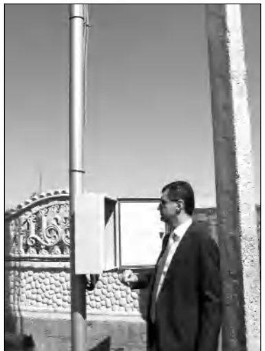
Նուրբերդի համայնքային կյանքի աշխուժացմանը:

Ի տարբերություն էլեկտրական լամպերի, LED լամպերն առավել արդյունավետ են դիմացկուն են, կարող են անհամեմատ ավելի երկար ծառայել՝ ստանդարտ 80 տարեկան դիմացկուն էլեկտրաէներգիա: Արտադրված լուսավորության բնադաստիարակման և էներգիայի միջոցով լուսավորության բնադաստիարակման էներգիայի շնորհիվ, գյուղերն էականորեն կրճատվեն իրենց ֆինանսական բեռը՝ խնայված միջոցները