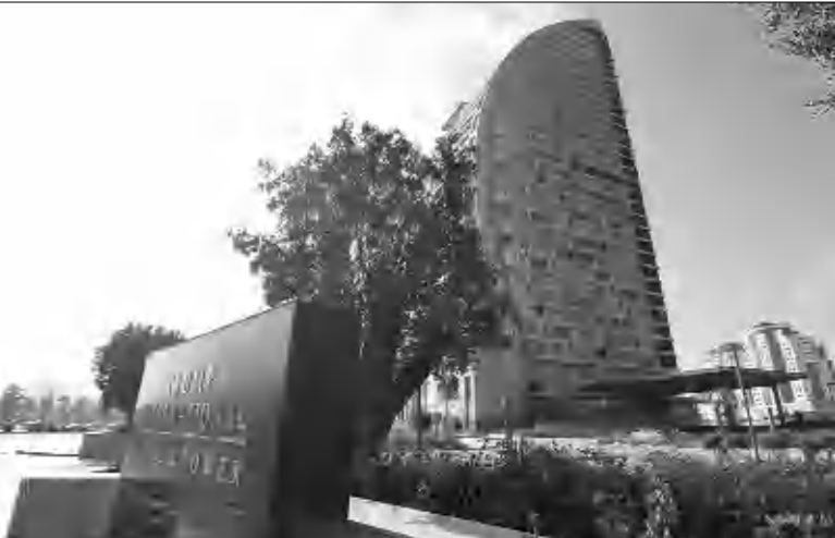
Բաբվում կառուցված հյուրանոցային համալիրը, որից Թրամփի կարգադրությամբ հանվել է Trump Tower ցուցանակը

դոստր հետ, սակայն նրան նույնիսկ ֆեյսբուքի ադրբեջանական հասվածում ծաղրեցին՝ նկատելով, որ ամեն ինչ ֆոտոտոս է: Հստակ արձանագրված փաստ է նաեւ, որ դաժանամուսից մի ֆանի օր առաջ Դոնալդ Թրամփը կարգադրել է, որդեսգի Բաբվում կառուցվող հյուրանոցային համալիրից հանվի Trump Tower ցուցանակը, ինչի դիմաց նա սարեկան 2,5 դոլար էր ստանում: