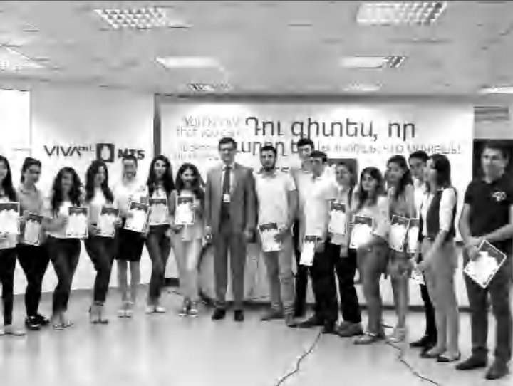
ՎիվաՍել-ՄՏՍ-ի «VivaStart» ծրագրի շնորհակալական դասընթացի ավարտը: Մասնակցություն են ունեցել 21 ուսանող: Մեծ շնորհակալություններով ՎիվաՍել-ՄՏՍ-ը արժանացել է ՎիվաՍել-ՄՏՍ-ի «VivaStart» ծրագրի շնորհակալական դասընթացի ավարտողներից: ՎիվաՍել-ՄՏՍ-ը հավասարապես են ստացել «VivaStart» ծրագրի այս արժանիքն ու շնորհը: Բարձրակարգ սոցիալական համայնքով որակի կարտեր ցուցիչ՝ ընկերությունը վաճառքի եւ բաժանորդների սոցիալական հասկացումն մասնագիտացված մեկնարկային հնարավորություն է սկսել սարքեր բուհերի ուսանողներից ձեռնարկված հեռախոսակառուցման խմբին: 21 ուսանող նախ մասնակցել է շնորհակալական դասընթացների, ա-

ՎիվաՍել-ՄՏՍ-ում հավասարապես են ստացել «VivaStart» ծրագրի այս արժանիքն ու շնորհը: Բարձրակարգ սոցիալական համայնքով որակի կարտեր ցուցիչ՝ ընկերությունը վաճառքի եւ բաժանորդների սոցիալական հասկացումն մասնագիտացված մեկնարկային հնարավորություն է սկսել սարքեր բուհերի ուսանողներից ձեռնարկված հեռախոսակառուցման խմբին: 21 ուսանող նախ մասնակցել է շնորհակալական դասընթացների, ա-