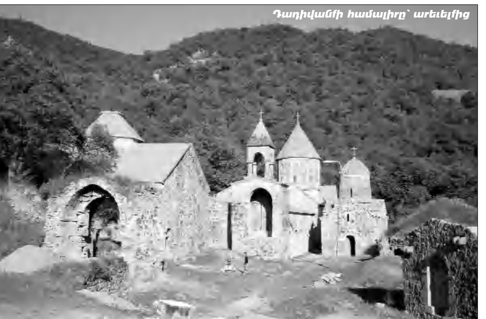
Դադիվանի համալիրը՝ արեւելից

XII դարում միառժամանակ Միխթար Գոռն էլ է այստեղ բնակվել եւ աշխատել իր «Դասասանագրի» վրա, որը հսկայական դեր ունի խաղար միջնադարյան հայ ֆաղաֆակրական կյանքում: Ընդհանրապես, 13-րդ դարը եղավ վանքի համար ծաղկուն ժամանակաշրջանը. Դադիվանն ուներ այգիներ, արտավայրեր, գյուղեր, գործում էին հյուրասներ, արհեստանոցներ ու գրադասանոցներ: Ասում են, ֆանիցս հայքնաքերել են դասերի մեջ դրված կժերում երկրորդային թաֆցրած ոսկիները: Այստեղ, ըստ երեւոյթին, մարդիկ միայն հավասի համար չէ, որ գոհվել են... Փոքր բլրով դասարկ վանական խցերի