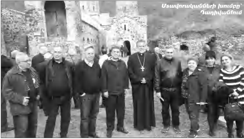
Սարավանից խումբը՝ Դադիվանում

Յամալիրի գլխավոր՝ Կաթողիկե եկեղեցին կառուցվել է 1234 կամ 1244 թ.: Նրա ներսում դաստիարակվել են XIII դ. որմնակարներ: Կաթողիկե արեւմտյան կող-