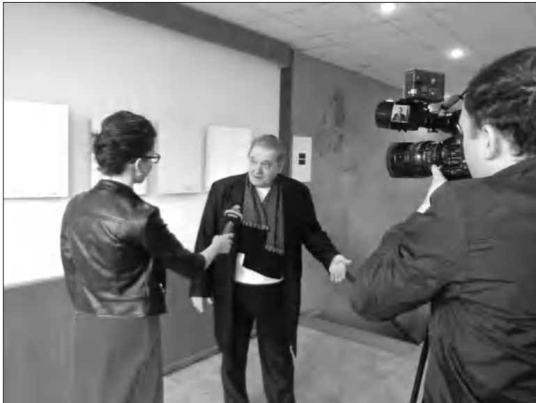
Toto-ն բացատրում է անբացատրելին