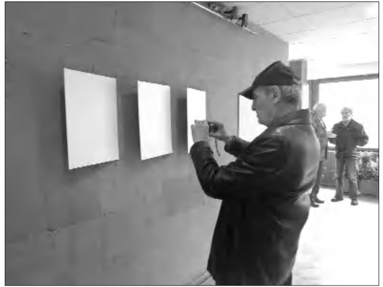
Պահը դեմք է անմահացնել

մնալ այս կամ այն կուսակցության, դաշինքի, բարձր ռեյտինգ ունեցող ուժերի շղայի կամ սիկնոջ լուսանկարները, ինչը նշանակում է, որ ընտրությունների բոլոր մասնակիցները օրենք էին խախտում, ծաղրանկարիչները որոշել էին օրենք չխախտել: Ցավոք, նրանք առանձին կուսակցություն չունեն՝ ասենք ԾԻԿ՝ Ծաղրանկարիչների իսկական կուսակցություն, եւ այդ կուսակցությունը չէր մասնակցում ընտրություններին, հակառակ դարադասում չի բացառվում, որ ընտրվեին, ֆանի որ ամրիկի մեկին, լռության օրը, հայ ծաղրանկարիչները միակն էին Հայաստանում, ովքեր համաձայն օրենքի՝ լուռ էին: