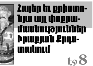
Հայեր եւ ցրիտոուեյա այլ փոքրամասնություններ Իրաքյան Ջրդուտանում