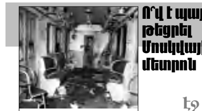
Ո՛ր է պայթեցրել Մոսկվայի մետրոն

1045թթ: ): Եվ ամենակարեւորը՝ հայերը դասկանում են այն փչ ժողովուրդների ցարքին, որը մ.թ.ա. I դարում ստեղծել է կայսրություն, եւ նրա կայսրը՝ Տիգրան Մեծը, կրել է «Արախից արա» իտղոքը: Դեություն գաղափարն ամուր նսած է հայության գեներում, եւ նա ուր գնում է, որ երկրում հաստատվում է, դեության գաղափարն իր հետ է տանում : Դրա վար