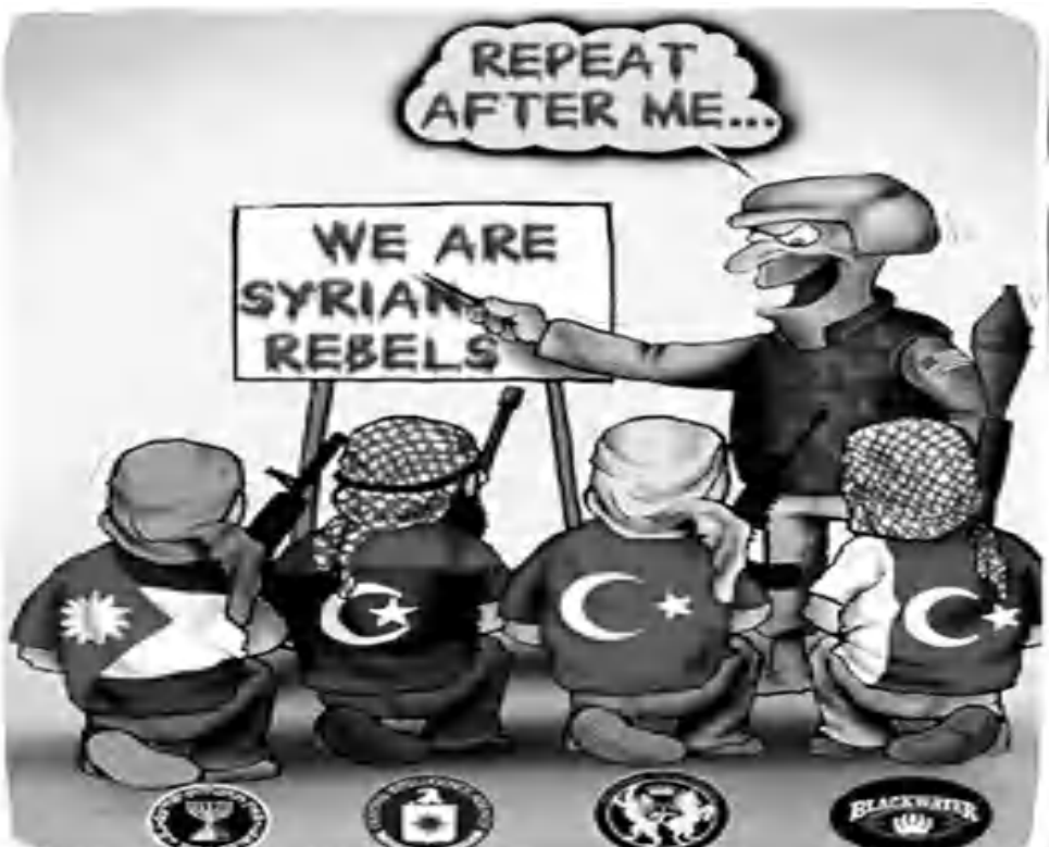
Ծաղրանկարում ԱՄՆ-ի ռազմական հրահանգիչը սովորեցնում է յորդանանցի, լիբիացի, թուրք և դակիսանցի ահաբեկիչներին.

«Մենք սիրիացի աղաժարներ ենք»: Նկարի ներում դաժկերում են Իսրայելի ՄՈՍԱԴ, ԱՄՆ-ի Կենտրոնական հետախուզական վարչութեան, Մ.Բրիտանիայի Ռազմական հետախուզութեան Մի-6 զաղանի ծառայութեան եւ ԱՄՆ-ի «Բլեբոլթեր» (այժմ՝ «Ակաղեմիա») մասնաւոր ռազմական (վարճկան զորեր հաւաղագրող) ընկերութեան յորհրղանճանները: