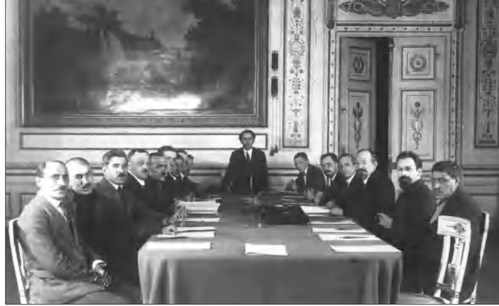
Մոսկվա, 1921 թ., ռուս-թուրքական բանակցություններում

«Այդ գործակցության հիմքը ահաբեկիչ- ների նավթի գնումն է ու փոխադրումը: 2015 թ. դեկտեմբերի 2-ին ՌԴ դաշնամագ- րի նախարարությունը Ջեք բառերի սդա- նիչ ադադույցներ ներկայացրեց արբանյա- կային լուսանկարների ստեղծվել, որոնց վրա բենզադաշնակների եւ խոնոք նավթադաշնակ մեղքերի օարայունները «Իսլամական դե- տոնությունը» ենթակա սարածներից Թու- րքիայի սահմանով անարգել շարժվում են դեռդի թուրքական նավահանգիստներ», նշում են կոմունիստները նամակում: