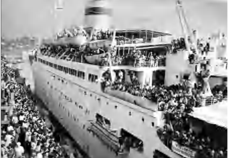
«Տրանսիլվանիա» շոգեմակը հայրենադարձներով լցնում է հեռանում է Մարսելի մավախանգուսից

Հայրենադարձության եւ հայրենալքման թեման թե՛ քարոզչի, սակայն մեր գրողները, զարթոնքի մասնակցներն ու հասարակագետները զարմանալիորեն խուսափում կամ քշանցում են այն: Ամբողջ ունենք, անձնական հուսադրություններում հասկառու, բազմաթիվ վկայություններ այդ թեմայի շուրջ, սակայն դեռեւս բացակայում են համադարձակ ու խորհային անդադարձումները հայ ժողովրդի 20-րդ դարի զարթոնքի ամենակարեւոր եւ, միաժամանակ, ցավալի այդ երեւույթի մասին: Թե՛ Երևան այն զարթոնքով, որ հայրենասիրական մեր առիթական ձգտումներին ձիշտ հակառակ՝ ազգային մեծ զարթոնքներն ենք գրանցել այդ աստարեզում ու դեռ շարունակում ենք գրանցել... Սկսելով մեր թերթի ներկա համարից՝ հաջորդական 5 համարներով մեր կայքէջում ենք գրականագետ եւ հեղինակ Ավիկ Իսահակյանի վկայությունների շարքը՝ իրեն հասուն զարթոնքական հեղափոխում է անկողմնակալ ու անբռնազբոս արդարանով գրված: Ընթերցողը, վստահ եմ, հետաքրքրված կարդալու է այս գործը, որը արժանի է առանձին գրքով լույս տեսնելու: