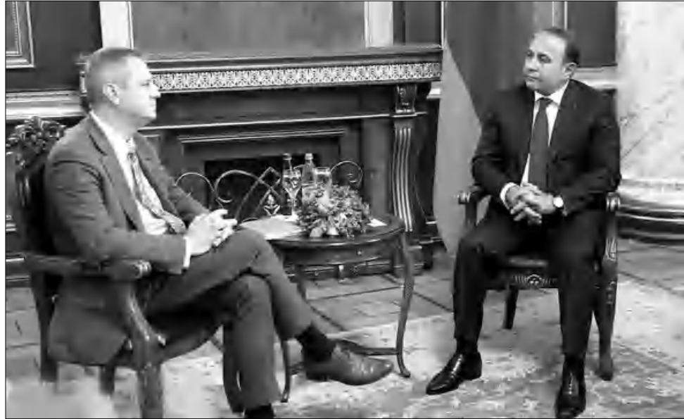
թյունները, որոնք հնարավոր կդարձնեն «Շնայդեր էլեկտրիկ»-ի ներդրումները մեր երկրում: Դրանք են՝ Հայաստանում այլընտրանքային, առաջին հերթին աշխարհի էներգետիկայի լուրջ ներուժը, նկատի ունենալով արեալին օրերի մեծա-

«Շնայդեր էլեկտրիկ»-ի մասին լիարժեք դաժանացում կազմելու համար բավական է ներկայացնել նրա հիմնական ցուցանիչները՝ սարեկան շրջանաղությունը 2015-ին՝ 26,6 մլրդ եվրո, 160 հազար աշխատակիցներ, 25 գիտատեխնիկական կենտրոններ, 200 գործարաններ ամբողջ աշխարհում եւ այլն: Ինչ վերաբերում է Հայաստանում ընկերության գործունեությանը, աղա Յոհան Վանդերդալտեստենը լրագրողների հետ հանդիմում ժամանակ մեցց մեր երկրի այն առավելու-