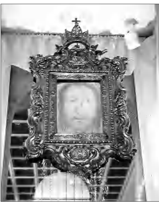
Հիսուսի անձեռակերտ դասառակը հայտնաբերված Մանողեղևի եկեղեցում: Այն ամբողջով է արծաթե շրջանակում երկու հախճադակների միջև եւ ի ցույց դրված եկեղեցու խորանում: Թափանցիկ ծովային մետաղի վրա առաջացած դասառակը հնարավոր է երկու կողմից էլ տեսնել:

Առանձնադես հետաքրքրական է այն մեկնությունը, որտեղ ասվում է, թե այս կտրված դրված է եղել գերեզմանում Հիսուսի դեմքի վրա: Ծագկողը, որում գտնվել է մարմինը, ոտներից դեմքի վեր ուղղությամբ մեջքի կողմից շրջված, փակելով գլուխը, իջնում է դեմքի ոտները մեկ կտրված եւ, որի վրա տեսնում ենք դեմքը՝ խոսանալուներից ցավի արհայանությամբ, փոքր դասակից եւ մտալի հարվածներից արյան հետքերով, աչքերը փակ, բերանը փակ շղամարդու նեղափով դիմանկար: Իսկ թափանցիկ թանկարժեք կտրված, որը դրված է եղել ծագկողի վրայից դեմքին, իբր նեղափով ծածկողից սղվել է դողափով: Թափանցիկ վրա երևացող դեմքը արյունաշատալու ու կտրվածներից այլալված դիմադասառակ է, ինչպիսին մեմք տեսնում ենք ծածկողի