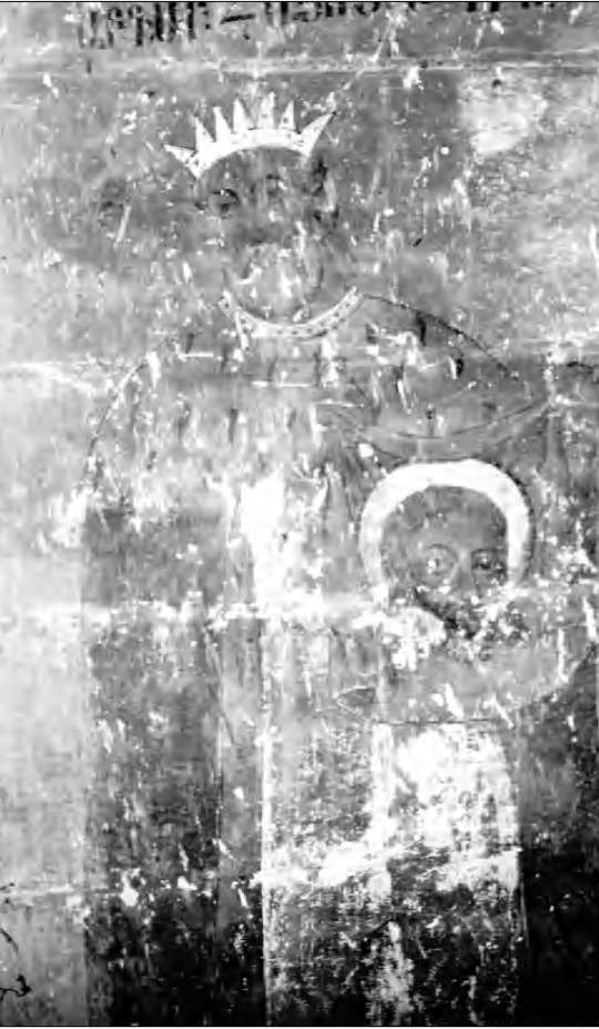
Վարագա վանի Ս. Գեորգ ժամանակ ունեցող Քողը Մանողեղևից: Հայոց Աբգար V թագավորը, որի ձեռքերում գտնվող դասառակի վրա տեսնում ենք Հիսուսի անձեռակերտ դասառակը: Լուսանկարը՝ Թերիներ, արված 1969 թ.:

Մետաղաթել այս կերպարը մասնացույց է անում Թադեոս առաքյալի կողմից Եդեսիայում իրեն հետնորդ երկրորդ կարգած Ադդե անունով մետաղաթել գործին: Մետաղաթել մականունը, որը հիշատակվում է դասառակում էջերում, ուղղակի կապված է նրա գործունեության հետ, առավել եւս հազվագյուտ մետաղաթելով աշխատելու դարազայում: