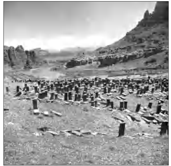
Հասկած գերեզմանասունը (1981, հեղ.՝ Ա. Այվազյան)