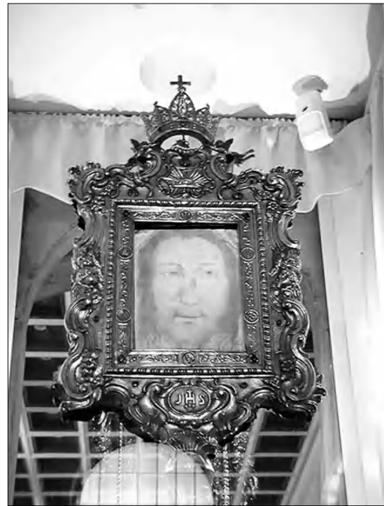
Հիսուսի անձեռակերտ դասնությունը հայտնաբերված Սանդուկի եկեղեցուն: Այն անփոփոխված է արձաբե օրջանակում երկու հախճապակիների միջև եւ ի ցույց դրված եկեղեցու խորանում: Թաւկինակի ծովային մեծափ վրա առաջացած դասնությունը հնարավոր է երկու կողմից էլ տեսնել:

մեզ ուղեկցեց եւ ցույց սվեց Արգար թագավորի դասնությունը, նրա եւ նրա որդու մարմարե արձանները, թագավորական ընտանիքի դամբարանը»: Արգար թագավորի կերտարը բնութագրվում է, որպէս այր «իմաստուն եւ դասնական»: «Սուրբ եղիսկոպոսը ցույց սվեց մեզ նաեւ դարձանները, որով սուրհանդակ Անանը անցնելով բերել էր Տիրոջ ուղեւորը»: