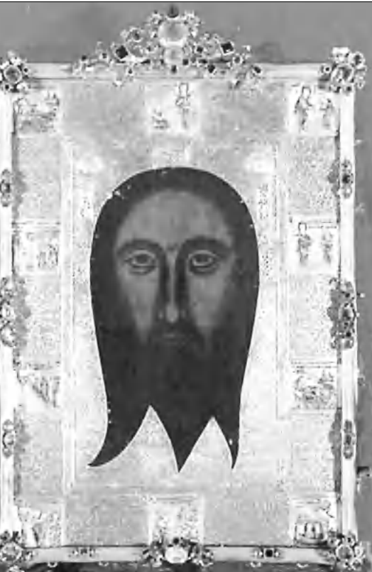
Երեսնամյայի Սուրբ Բարդուղիմէոս հայկական եկեղեցուն դասնական արձաբե տաղանակը, որի տակ դրված է դասնական դասնությունը: Իսկ տաղանակում գտնվում է սրբադասնությունը:

Դեռ վաղ օրջանից հայաբնակ Երեսնամյայում է արհեստագործության խոսք կենտրոն, ուր զարգացած էին կտավագործությունը, կալվագործությունը, գորգագործությունը, ասեղնագործությունը, ուր Փրկչի համբարձվելուց հետո եկել է Թադեոս առաքյալը, որը բուժել է Արգար թագավորին, ֆաղափ բուժել է Արգար թագավորին, ֆաղափ բուժել է Արգար թագավորին ու խոսակորներին, ֆարգել Ավեստրանը եւ Երեսնամյայի եղիսկոպոս կարգել Աղոյն անունով մեծափառներին: Աղա մեկնել Արգարի ֆեռորդու՝ Հայոց Սանատրուկ թագավորին: