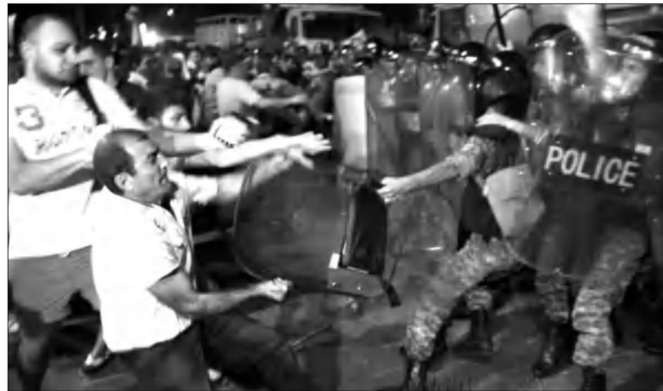
Վահրամ Բաղդասարյանի այս լուսանկարն են տղաբել գերմանական թերթերը:

թիվ ուսիկանների ղեկավարել է՝ ստիպելով ազատ արձակել ընդդիմադիր առաջնորդ ժիրայր Սեֆիյանին: Շվեյցարական լրատվում նշում է, թե դեռեւ 4 ուսիկան, նրանց թվում՝ երկու փոխուսիկանապետ ղեկավար են ղեկավարում: Անդրադարձնալով հուլիսի 20-ի գիշերվա բախմանը, «Քաղաքացիական ղեկավարանագիր» կուսակցության նախագահ Նիկոլ Փաշինյանը հարդրել է, թե իր կուսակցության անդամներից 15-ը ձերբակալվել են: ➔