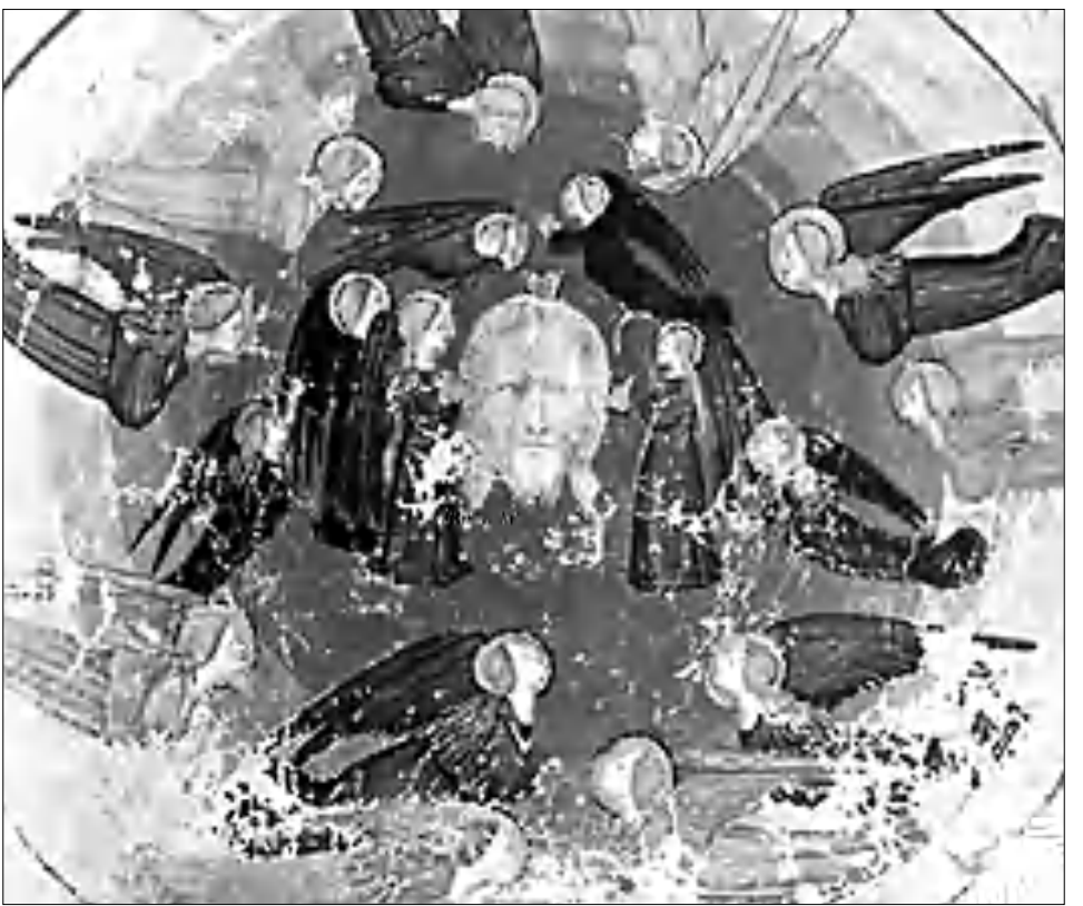
Նկարագրում Դանթե Ալեգիերիի «Ասվածային Կասկերություն» ձեռագրից. Վենետիկ 1390թ.

Մաթեոսի, Մարկոսի ավեստրաններում ծածկոցի մասին խոսք բնավ չկա: Հիսուսի մարմինը ծածկած կտավների մասին տեղում է Ղուկասի ավեստրանում (ՊԼ-ԻԴ 12): Իսկ Հովհաննու ավեստրանում կարդում ենք ծածկոցի մասին,