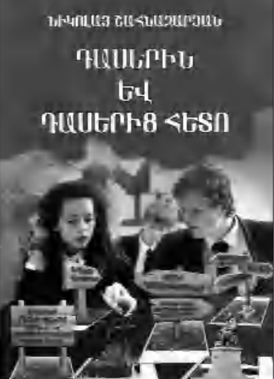
հեղինակները, դրանք հեղինակների ո՞ր տեսակն են:

«Գրական-երագունական վիկտորիան» ենթաբաժնում (էջեր 46-48) ներկայացվել են մի շարք առաջադրանքներ, որոնք դասնագում են դասասխանել՝ ո՞վ է այս կամ այն գրական ստեղծագործության երագունությունն ստեղծել: Այսպես՝ «Ռվ է Ղ. Ալիսանի «Պոլուլն Ավարայրի» երգի հեղինակը», «Ռվ-