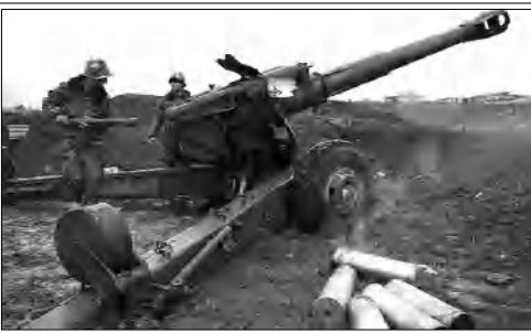
Արցախի ՊԲ հրեաներին կրակելիս