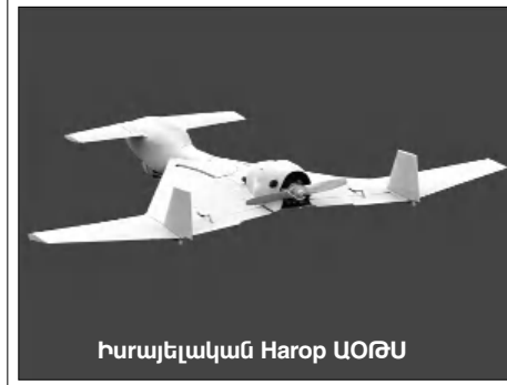
Իսրայելական Harop ԱՕԹՍ