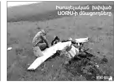
Իսրայելական խված ԱՕԹՍ-ի մնացորդները