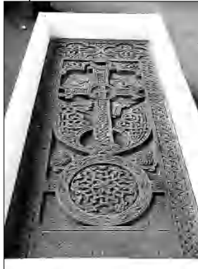
Գերմանահայոց առաջնորդ Գարեգին արք. Բեկչյանը, ներկա են լինելու Բենիմուն Գ. Գրանասանի դեսպանները: Թերթը նույն է, թե նման խաչքարե անցյալ սարի արդեն սեղանի վրա են գերմանական 4 այլ ֆալսիֆիկացիոն, այդ թվում՝ Հայաստանի խաչքարը սեղանի վրա շաբաթ ամրիլի 16-ին երկրորդ կեսին Յենա, նվիրաբերում է Հայաստանին, հայ եւ հույն ծնողներից ստեղծված, այժմ գերմանական գործարար Փոլ Գուլյուրուն: Խաչքարն օժտելու էր հայոց եռագույնը՝ որդես սպիտակ կիսով չափ խոնարհելով այն: ԱՆԱՏԻՏ ՏՈՒՆԻՎԵՐՍԻՏԵՏ, Գերմանիա

Գերմանական Յենա քաղաքում ամրիլի 17-ին, ժամը 11.30-ին Հայաստանից բերված խաչքար կանգնեցվի՝ ի հիշատակ Հայոց ցեղասպանության 1,5 միլիոն զոհերի, ամրիլի 13-ին ծանուցում է «Օսթրիայից ցայտնված» մանրամասնելով, որ ամրիլի 16-ին, ժամը 19-ին ֆալսիֆիկացիոն ռեպլիկաներով «Նախաձեռնված բանաստեղծներ» վերնագրով հուշ տեղի կանցկացվի, որի ընթացքում ելույթի հնարավորություն կստանա հայ դաժնակահարներին: Հուշարձանը կամփոփի նաեւ առաջին համաշխարհային թափուրածի ժամանակ Օսմանյան կայսրության սարածում ստանված ֆրիսոնյա սառիների, արանեացիների եւ փոքրասիացի հույների հիշատակը: Մոս 2 մեթր բարձրություն ունեցող խաչքարը, որ շաբաթ ամրիլի 16-ին երկրորդ կեսին Յենա, նվիրաբերում է Հայաստանին, հայ եւ հույն ծնողներից ստեղծված, այժմ գերմանական գործարար Փոլ Գուլյուրուն: Խաչքարն օժտելու էր հայոց եռագույնը՝ որդես սպիտակ կիսով չափ խոնարհելով այն: ԱՆԱՏԻՏ ՏՈՒՆԻՎԵՐՍԻՏԵՏ, Գերմանիա