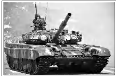
Արցախի ՊԲ S-72 սանկ

13. Կամիկադե-ԱՕԹՍ-ները նոր մահաբեր գեներ են, որոնց առաջին անգամ լյանորեն կիրառումը մեծ առավելություն էր սալիս ազդեցող կողմին՝ Արցախյանին: