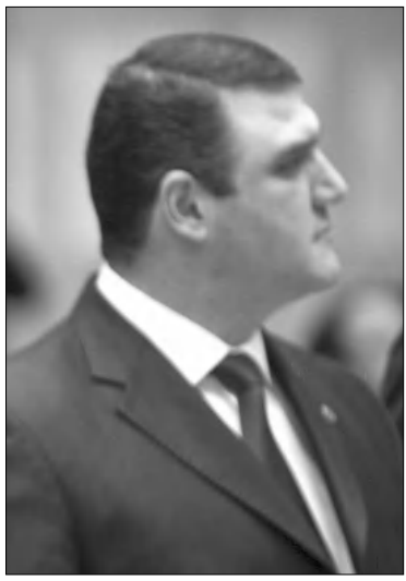
խտրականության արգելք դառնալ մեկը մյուսի նկատմամբ գերակայություն չունեն: