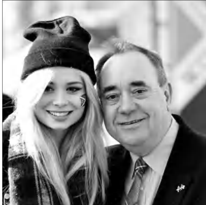
«Այս հանրաքվեին չի վերաբերում որևէ կուսակցության կամ վարչապետի... խոսքը Շուրաբեյի առաջին շուրաբեյի հանձնելու մասին է», ընդգծել է Ալեքս Սալմոնը:

Ֆրանսիական «Մոնդո» օրաթերթը գրում է, որ Եվրոպայի նախագահի մայրաքաղաք Ադրբեյհանում Շուրաբեյի ազգային կուսակցության համագումարի առիթով հավաքված հարյուրավոր մարդկանց առջև ելույթ ունենալով՝ կուսակցության Սալմոնը հորդորել է փետրվել անկախության օգտին: