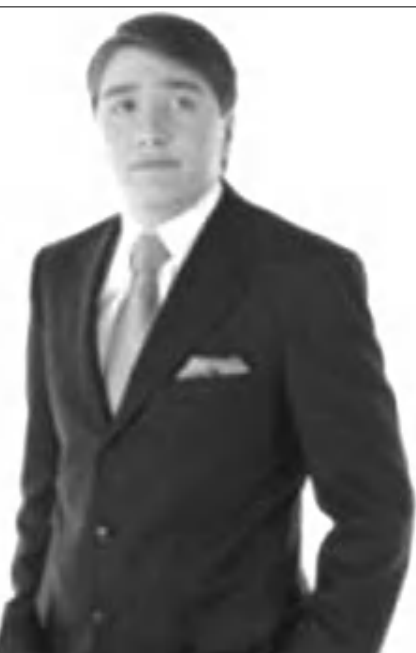
Ղազախստանից 22 ամսվա բանտարկության:

Իյասի անձի ձեռնարկում գործում մեծ ներդրում է ունեցել փախած օլիգարխ Մուխտար Աբլիազովը, որի աղջկա հետ ամուսնացել էր այդ երեւմտի սուսուփուս եւ համեստ շղան: Մուխտարը հայտնի կերպար է «սոփիստ օմիգա» հանցագործների աշխարհում, որը դարձավ նրա համար ֆինանսական գուրու՝ անհրաժեշտ դերակատարն օգնելով բարի խորհրդով եւ փողով: Ձկան ղեկ կողմնորոշվելով օֆշորների ողորդչությանը՝ ամերը ցույց սվեց փեսային բարձրագույն ղեկավար, երբ դուրս բերեց բազմաթիվ միլիարդ սենգետ արժեքով ակտիվները ղազախստանյան «ԲՏԱ» բանկից, ինչից հետո հաջողությամբ հեռացավ Լոնդոն: