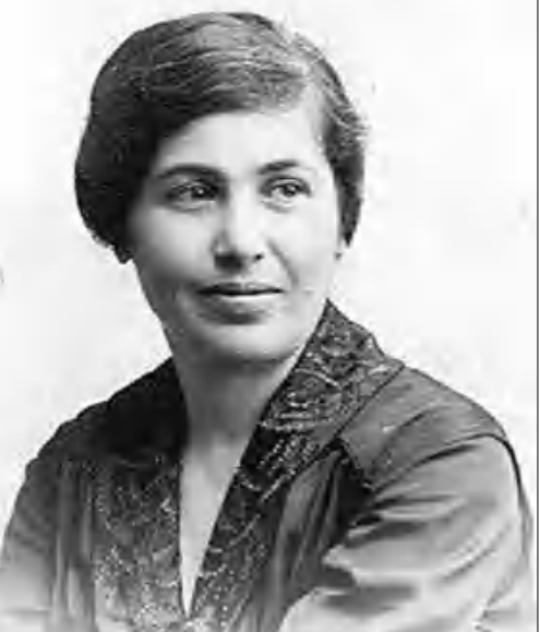
րին հաջողվել է հետեւել Փարիզում (1895-ից) Սորբոնի եւ Քոլեժ դը Ֆրանսի գրականության եւ փիլիսոփայության դասընթաց-