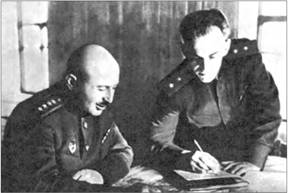
1-ին Մերձբալթյան ռազմաճակատի շարժման հրամանատար մարշալ Բաղդամյանը եւ շարժման Կուրսկի ճակատում են սեղանի վրա: 1944 թ.

մանասար գեներալ-մայոր Անդրանիկ Ղազարյանի անունը: Բելառուսի ազատագրման հերոսական զորքերի մեջ ոսկե տառերով է գրված առաջին Մերձբալթյան ռազմաճակատի հրամանատար, այն ժամանակ բանակի գեներալ Գրիգորյանի անունը: Այդ նրա գլխավորած Գորոդկայան հարձակողական գործողության արդյունքում խորհրդային զորքերը ջախջախեցին ֆաշիստների դիմադրությունը Նեյելից արեւմուտք եւ հարավ-արեւմուտք: Հայ եւ բելառուս զորքերի մասնակցների համատեղ ջանքերով վեր են հանվել ավելի քան հազար հայերի անուններ, որոնք կոչվել են զորքերի անուններով եւ զուգահեռաբար: Մեծ հաղթանակի կառը մեր օրերի հետ