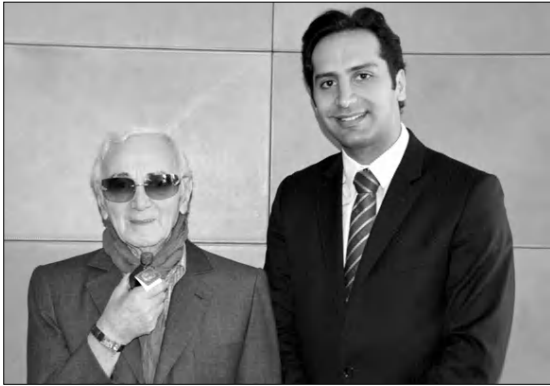
այս բարեսիրական ծրագրի յաջողութեան օգնելու համար հայ ազգի դարբնոց-դորոցներուն:

2013 թուականին, լիբանանահայ նշանավոր նսկերչական «Եփրեմ» հաստատութիւնը նախաձեռնեց «Խաչբար» նսկերչական արհմիութեան արհմիութեան նախաձեռնութեան մասնակցութեամբ մասնակցելու «Խաչբար»-ի որեւէ գնում, կը նմանատեղ հայկական ժառանգութեան երկարակետութեան, մասնաւորապէս 5 տարեկան միջին տարեկան հայկական դպրոցներու օգնութեան հիմնադրամին: