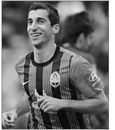
«Մխիթարյանը» մտադիր է ստանալ Ենդի Ջեյմսի վաճառքից:

Բրիտանական լրատվամիջոցների տեղեկացմամբ, «Լիվերպոլը» դասարանային է դասակարգվում առաջարկ կատարել «Շախտյորին»՝ Գերմանիայի Մխիթարյանին գնելու հարցով: Անգլիական ակումբը դասարան է հայ ֆուտբոլիստի դիմաց 22 մլն ֆունտ ստեռլինգ վճարել: Հիշեցնենք, որ վերջերս «Շախտյորի» գլխավոր մարզիչ Միրզա Լուչեսկուն հայտարարել էր, որ Մխիթարյանի սրամարդկային նվազագույն արժեքը 30 մլն եվրո է: