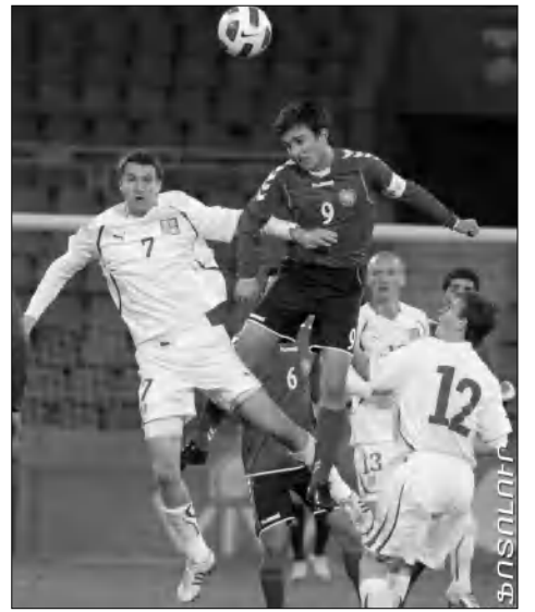
Ֆուտբոլի խաղի ժամանակ: ՖԱՆՏՈՒՄ

Երեկ Հվեյցարիայի Նիոն քաղաքում կայացավ 2015-ի ֆուտբոլի Եվրոպայի երիտասարդական առաջնության ընտրական մրցաշարի վիճակահանությունը: Հայաստանի երիտասարդական հավաքականը ընդգրկվել է ընտրական վերջին 10-րդ խմբում, որտեղ մրցակիցներն են Ֆրանսիայի, Բելառուսի, Իսլանդիայի և Ղազախստանի ընտրականները: