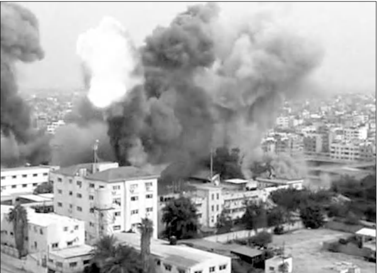
«Զգրուլահի» եւ Սիրիայի իշխանությունների հաղորդումների համաձայն, հունվարի 30-ին իսրայելական ռազմաօդային ուժերը հարվածել էին Դամասկոսի արվարձանում գտնվող հետազոտական կենտրոնին: Այլ տեղեկությունների համաձայն, թիրակելով իրեն «վսանգավոր եւսուղողացի»: «Նյու Յորք թայմսը» սեփական աղբյուրներ վկայակոչելով գրում է, որ Սիրիան ռմբակոծելուց առաջ իսրայելը ԱՄՆ-ին տեղեկացրել էր իր մտադրության մասին: Տես էջ 2

Ղուբայում, իսկ հունվարի 24-ին ցուցարարները հրկիզեցին Իսմայիլի «Չիրադ» հյուրանոցը եւ գործադիր իշխանության ղեկավարի «առանձնաձայն հանգստի գոհի» բակում կայանած 5 մեքենայի եւ 2 ֆառանիվ մոտոցիկլետի հետ»: «Թուրան» գործակալությունը տեղեկացրել է, որ Բաֆլի «խորհրդանիշ հանդիսացող» Baku Flame Towers-ի 150 բանվորներ երեկվանից անժամկետ գործադու են հայտարարել: Մի ֆանի օր առաջ նրանք փորձել էին արգելափակել Միլի մեջլիսի փողոցը, սակայն ոստիկանությունը դաժանորեն ցրել էր ակցիան: Ըստ «Թուրանի»՝ բանվորները «հիմնականում Թուրքիայի ֆաղափարներ են, որոնք Բաֆլում աշխատում են առանց դրա համար օրինական հիմքի»: Տես էջ 5