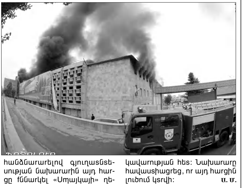
հանձնարարելով գյուղատնտեսության նախարարին այդ հարցը ֆնանսավել «Մոլայկայի» ընկերության հետ: Նախարարը հավաստիացրեց, որ այդ հարցին լուծում կգտնվի: Մ. Ք.