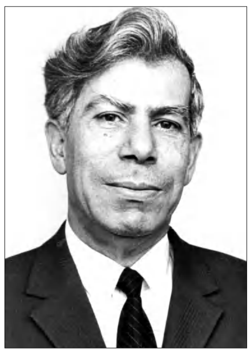
Տակավան աստիճան: Աշխատանքի առաջին հասարակ յույս է տեսել 1958, երկրորդ՝ 1962 թվականին:

Հայկական բնաշխարհի այդ հեռավոր, գեղեցիկ ու բանաստեղծական անկյունը իր ընտրյալ զավակի մեջ խնայել էր մարդկային բոլոր շնորհները՝ ուժեղ, կուռ սրամաքանություն (այստեղից էլ՝ սերը մաթեմատիկայի եւ հարակից գիտությունների ու մասնագիտությունների նկատմամբ), գեղեցիկի ու բանաստեղծության նուրբ զգացողություն (այստեղից էլ՝ սերը հայ դասական դրեզիայի նկատմամբ) եւ անսահման սեր ու անմահացող նվիրում մեր մեծասանը մայրենիին: Մայրենի լեզվի ու նրա դասական համոզող այդ մեծ սերն ու նվիրումը ուղեկցեցին նրան ողջ կյանքում: Այդ սերն էլ բերեց նրան մայր բուհ, ուր աշակերտեց բանասիրական գիտության այն ժամանակվա մեր բոլոր նշանավոր դեմքերին՝ Մանուկ Աբեղյան, Գրիգոր Ղափանցյան, Հրաչյա Աճառյան, Արսեն Տերտրյան եւ ուրիշներ: Բացառիկ էր հասկացում մեծանուն Աճառյանի դերը, որը ուսումնառության հետն սկզբից նկատել էր դասարան մեծ ընդունակություններն ու սերը հասկացում լեզվաբանական առարկաների նկատմամբ: Աշակերտ էլ ուղիական նվիրումով կառվեց իր մեծ ուսուցչի հետ, եւ այդ կառուցումն ավելեց ու առավել ամրացավ հետագա ողջ կյանքում: