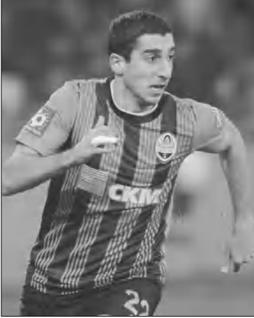
Կանությունը, որ Մխիթարյանը կգերազանցի ռեկորդը: Ուստի դասական չէ, որ հարցման մասնակիցների մեծամասնությունը դրանում վստահ է:

Դոմեցկի «Շախտյորի» դասական կայքը հարցում էր անցկացրել, որի նյութակն էր դարձել, թե շեմբաթյան Մխիթարյանի ընթացիկ առաջնությունում քանի գոլ կխփի: Հարցման ընդհանուր առմամբ մասնակցել են 978 ֆուտբոլատերներ: Նրանց մեծամասնությունը (970 հոգի) վստահ է, որ Մխիթարյանը կգերազանցի Ուկրաինայի առաջնությունների արդյունավետության ռեկորդը, որը դասականում էր Կիեվի «Դինամոյի» նախկին ֆուտբոլիստ Սերգեյ Ռեբրովին ու Մախիմ Շաքլիխիին: Նրանք մեծ մրցաշրջանում 22 գոլ էին խփել: Ինչպես հայտնի է, շեմբաթյան «Չախտյորի» հետ առաջնության 24-րդ տուրում խփել էր իր 22-րդ գոլը եւ կրկին էր արդյունավետության ռեկորդը: Առաջնության ավարտից դեռ 6 տուր կա, այնպես որ Կիեվի մեծ ե հավանա-