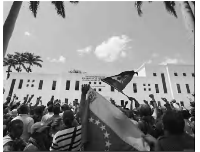
Կոծումը եւ հայտարարում ենք, որ թույլ չենք տա հեղափոխումը:», ասել է Մադուրոն:

Վենեսուելայի նորընտիր նախագահ Նիկոլաս Մադուրոն երկրի իրադրության առաջնությունացման համար մեղադրել է աջ ուժերին, ավելացնելով, որ նրանք բողոքի ձեռնարկումները հրահրվում են ԱՄՆ դեսպոտարսամենսին: Մադուրոն շարունակաբար պահանջում է հայտնել իր բոլոր կողմնակիցներին և հաստատել կոչ է արել վենեսուելացիներին: