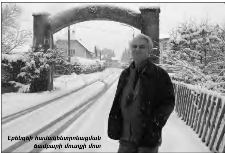
Էբենզեի համակենտրոնացման ճամբարի մուտքի մոտ

ընդհանուր նկարագրություն, Ավստրիայի՝ մեր ցեղասպանությունը չընդունելու մասնաճյուղերը, զարբեր ցեղասպանությունների համեմատության հնարավորությունը: Նախ անդրադարձա Ավստրիայի դառնալից 4 կուսակցությունների դիրքորոշումներին: Դրանք են՝ Սոցիալ-դեմոկրատական կուսակցությունը՝ «Թուրիայի ներքին իրողություններին միջամտել չի կարելի»: «Ազատություն» կուսակցությունը՝ «Բոլոր արարողությունները դրսից հակաարդյունավետ են»: Ժողովրդական կուսակցությունը՝ «Մի երկրի անցյալը վերանայելու մորոցեսին չդիմադրվել»: «Կանաչների» կուսակցությունը միակն էր հակառակ դիրքորոշմամբ՝ «Քանի որ Ավստրիան այդ սարինե-