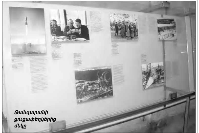
Թանգարանի ցուցափեղկերից մեկը

ընդհանուր նկարագրություն, Ավստրիայի՝ մեր ցեղասպանությունը չընդունելու մասնաճյուղերը, զարբեր ցեղասպանությունների համեմատության հնարավորությունը: Նախ անդրադարձա Ավստրիայի դառնալից 4 կուսակցությունների դիրքորոշումներին: Դրանք են՝ Սոցիալ-դեմոկրատական կուսակցությունը՝ «Թուրիայի ներքին իրողություններին միջամտել չի կարելի»: «Ազատություն» կուսակցությունը՝ «Բոլոր արարողությունները դրսից հակաարդյունավետ են»: Ժողովրդական կուսակցությունը՝ «Մի երկրի անցյալը վերանայելու մորոցեսին չդիմադրվել»: «Կանաչների» կուսակցությունը միակն էր հակառակ դիրքորոշմամբ՝ «Քանի որ Ավստրիան այդ սարինե-