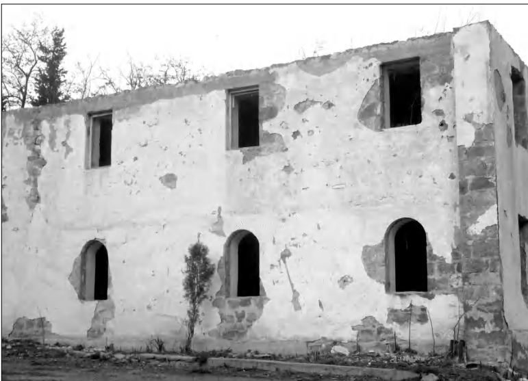
Ծխախոտի նախկին գործարանի շենքը