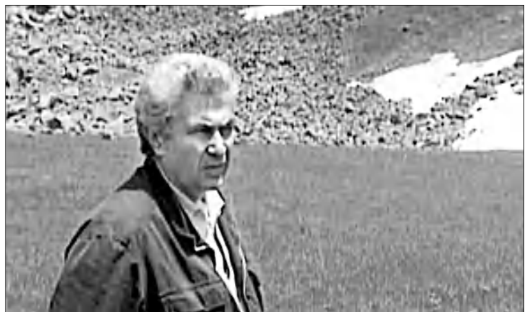
Ինչպե՞ս արգելափակել Քամի՝ սերունդ է Ու քանի դար է, Որ մնացել է մեծախոսություն...»:

րեն հեռու էր դառնում առանցիկ գործերից՝ առավոտից սրամաղրվելով որդուն սարերում ընդունելու երանակները։ Ամառվա եւ վաղ առանց ամիսներին բազում անգամներ էին իրենց հանդիպումները, բայց այդ օրվա որդու գալը մի առանձնակի նշանակություն էր ստանում հոր համար, եւ ամենամյա այդ օրվա իրադարձության հաճելի կրկնության մեջ հրաշալի մի զգացողություն կարո՞ւ էր իսկուհի էր բերում։