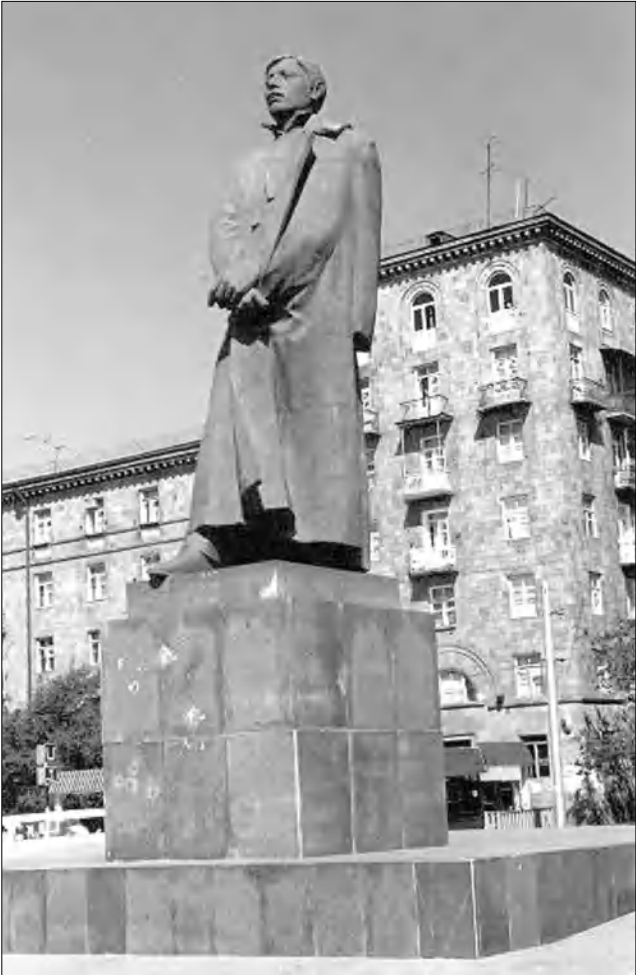
Նազնեմ, կնամանեցնե՛ն Նժդեհին, կասկածում էին ու մահ: Խոսքն ամենեւին հեղափոխական գործիչ Սուրեն Մղանդարյանի դեմ չէ: Զավ լիցի: Մեծ հարգանքներով մի անուն՝ սկզբունքային հեղափոխական, խմբագիր, բազմաթիվ լեզուների ինքնուրույն մտածողական, սակայն ի՞նչ վաստակ է ունեցել նա հայ ժողովրդի կյանքում: Թե՛րեւ լեզունդար Կամոյի, Գայի, Շահումյանի մասին լուրջ ավելի գիտեմ...

Երեսանցիների սիրված վայրերից էր այս հրապարակը ասանակներն առաջ, ուր ձկնակերոջ արձանիկներից բխող լուրջանների ձայնին խառնվում էին մեծ ու մանուկի խոսքն ու ծիծաղը: Բրնձաձուլ զարդաքանդակներն ու լուրջանները աղանձսածեցին, հանվեցին սրանվայի գծերը: Տեղը զիջվեց մեծադիմացիներին: Հրապարակի եռուզեղ լուրջ ու մսավ ստորագրեցին խանութներ ու սոնավաճառներ: Մեծոյի Երրորդ մասի կայարանը կոչվեց Սուրեն Մղանդարյանի անվան, հրապարակն էլ դեռ է համահունչ լինել: Պակասում էր միայն արձանը: Խորհրդային երջանի վերջին տարիներն էին: Դարակազմիկ փոփոխությունները հաջորդում էին միմյանց: Արցախյան շարժում, խորհրդային համակարգի փլուզում, հայ ազգային ինքնության զարթոնք ու ընդլուրծում: Արձանը դաստիարակ էր, իսկ դրսում արդեն փողփողում էր հայոց եռագույնը: Ի՞նչ անել, արձանի վրա անհագին ծախս էր արված... Գիշերով, ժողովրդի աչից թափում, այնուամենայնիվ, սեղանդեղ լուրջանը հանդիմանում: Հետո հրապարակը վերանվանվեց Գարեգին Նժդեհի անվան, իսկ արձանը... դե, մի փչ դիմագծերը կփոխեն, կսիրու-