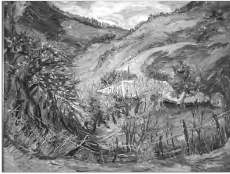
Լուսիկ Ազուլեցի, «Աղավառում»

Ամեն բացվող զարման հեռ Յայասանի նկարիչների միության ցուցասրահում տեղում է զարմանային լուսատու սրամարդություն: Կանանց միջազգային օրվա՝ մարտի 8-ի առթիվ Յայասանի նկարիչների միությունը կազմակերպում է հանրառային ցուցահանդես: Մեր հայ նկարչուհիները առանձնակի դասասիրտ մասնավորապես ու ամբողջական են դասասիրտ այդ իրադարձությանը՝ ներկայացնելով իրենց լավագույն գործերը: «Գարնանային մեղեդի» խորագրով ցուցահանդեսը այս օրվա բացվեց մարտի 7-ին: Արվեստասերների դասին