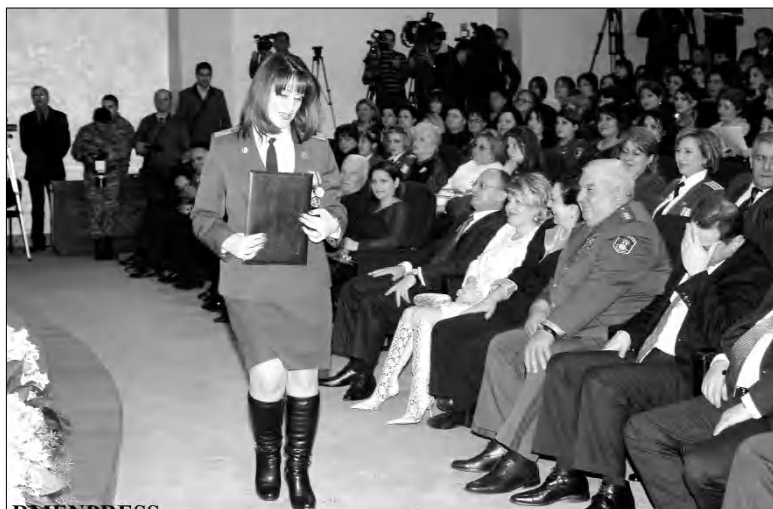
հավասար լիարժեք է, մասնաշեղ, կիսել ծանրագույն դժվարու- թյուններ: Արդյո՞ք սխալագործու- թյուն չէ՞, որ կինո ուղի է ուղար- կում՝ հայրենիքի սահմանը դաստրազմելու», ասում է նա- խարար՝ հավելելով, որ ինչպես դաստրազմական, այնպես էլ այլ գերաստեղծություններում կանանց մերկայությունն իրեն միտ էլ հա- ճույք է դաստրազմում: Նրա հա- վաստմանը՝ կանայք ոչ միայն մթնոլորտ են փոխում, այլև ստի- դում են, որ սրահամարդիկ ավելի գույտ ու կոռեկտ լինեն:

ճեմ, որ իրենց երեխաներն աղա- հով, հզոր ու կայացած դաստրա- թյան մեջ են աղյուս: Մենք դաս- հանց ու բողոք ունենք ու դա դաս է բավարարվի: Մենք ստատելի ու- նենք, որ որեւէ երեխա երբեք հար- ցակամի սակ չընի իր հոր նախա-