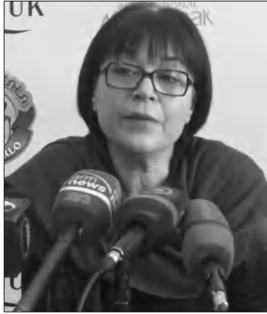
Ֆրանսերեն, իտալերեն եւ բուլղարերեն:

Բուլղարացի լրագրող, ռեժիսոր, սցենարիստ, Կինովավերագիրների միջազգային ասոցիացիայի անդամ Յվեսանա Պասկալեան երեկ հայ լրագրողներին ներկայացրեց իր «Ղարաքաղի վերերը» ֆիլմաձևը, որը ներկայացնում է Ղարաքաղում 90-ական թվականներին կատարվածը: