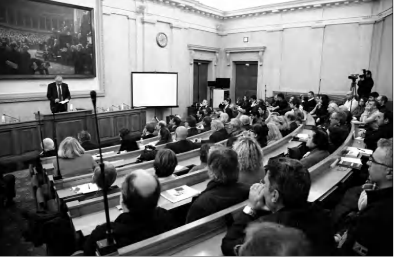
խորհրդարանական Ֆրանսուա Ռոբբերտի նախաձեռնությամբ ու մի քանի խորհրդարանականների մասնակցությամբ, դարձել է ազդեցուն հերթական թեման՝ աշխարհին աղավաղված, կեղծված և սեռականություններ փոխանցելու համար: Իսկ Պաշտոնը բնավ էլ ոչ այնքան միջոցառման բովանդակությունն է, այլ այն, որ այդ ժամանակ ծեծկռտվել է երկու ունեցել հայերի և ադրբեջանցիների միջև, ընդ որում՝ վերջիններիս

«Սումգայիթի դեղերը 25 սարի անց... Մասնավորապես, երբ միջոցառման մասնակիցները լուրջաբար հարգել են գոհերի հիշատակը, ադրբեջանցիները ոսխարժեղ մեղք են գործում...»