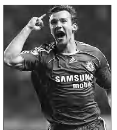
հետ հանդիպումը՝ դաշտակալ գոլի հեղինակ: Այդ խաղում 4-2 հաւճակով հաղթել էին «Միլանի» վեստերմանները:

Ինդոնեզական «Միսու Կուկար» ակումբի ղեկավարութիւնը հետաքրքրական առաջարկ է արել Եվրո-2012-ից հետո ֆուտբոլային կարիերան ավարտած Անդրեյ Շեչենկոյին: Ակումբը դաշտապահ է 36-ամյա ֆուտբոլիստին թիմի կազմում անցկացնելիք 5 հանդիպումներից յուրաքանչյուրի համար վճարել մոտ 1 մլրդ ռուբլի (100 հազար դոլար):