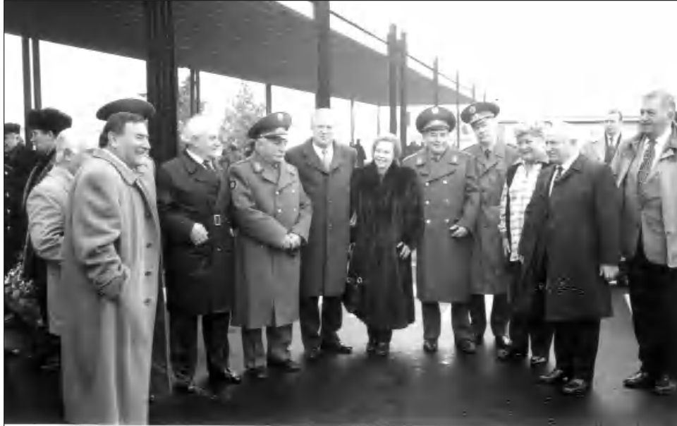
Կենտրոնում՝ Նիկոլայ Ռիժկովը եւ պաշտպանության նախարար Յազովը

- Գուցե մի փչ չափազանցված է, բայց ողբերգության ամբողջական ղեկավարը կինոժողովունի մասն դրոսվել է հիշողության մեջ: Դրանք դրվագ